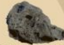
en roche volcanique