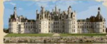
L'origine du château de Chambord remonte au XVI e siècle Sa construction commence en 1519, sous le règne de François I er

en 1786 EN 1889 Dans l'Antiquité au XVII e siècle AU XX e siècle au Moyen Âge à l'époque de la Renaissance à l'époque de Louis XIV Sous le règne de François I er L'architecture du XVI e siècle