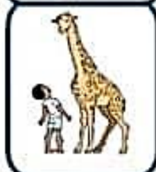
L'Afrique du Sud